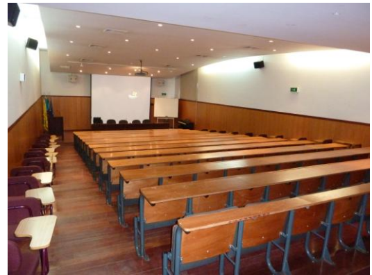
Hörsaal für unseren Unterricht