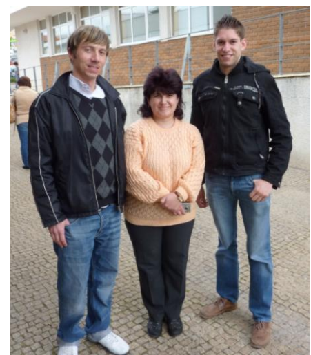
Treffen mit Kollegin aus Bulgarien